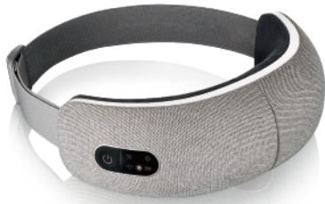
亮眼氣壓按摩眼罩