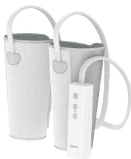
氣壓波動美腿按摩器