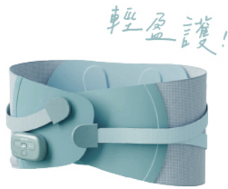
免持舒緩護腰按摩帶