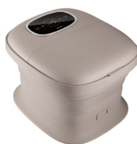
電動按摩摺疊足浴機