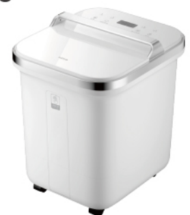
SPA噴淋電動高桶足浴機