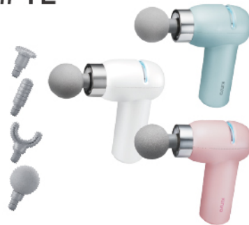
小舒肌·迷你6段筋膜槍