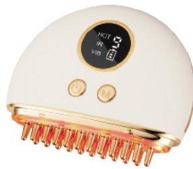
舒活經絡梳刮痧儀