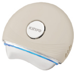
冷熱嫩顏美容刮痧儀