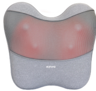
隨時躺·電動腰背按摩枕