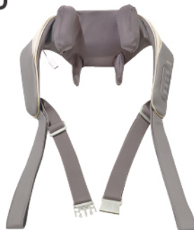
免手持肩頸揉捏按摩器