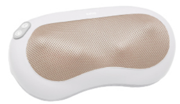
小腰果·多功能按摩器