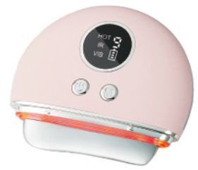
溫熱導入刮痧按摩儀