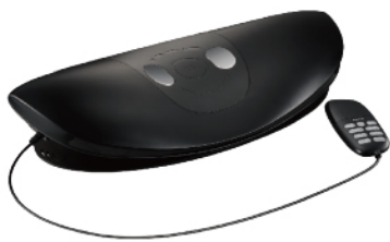
搖搖樂·腰椎舒展按摩器