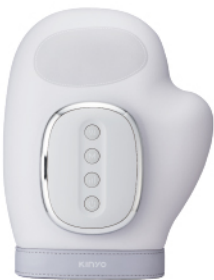
溫揉壓手部按摩器